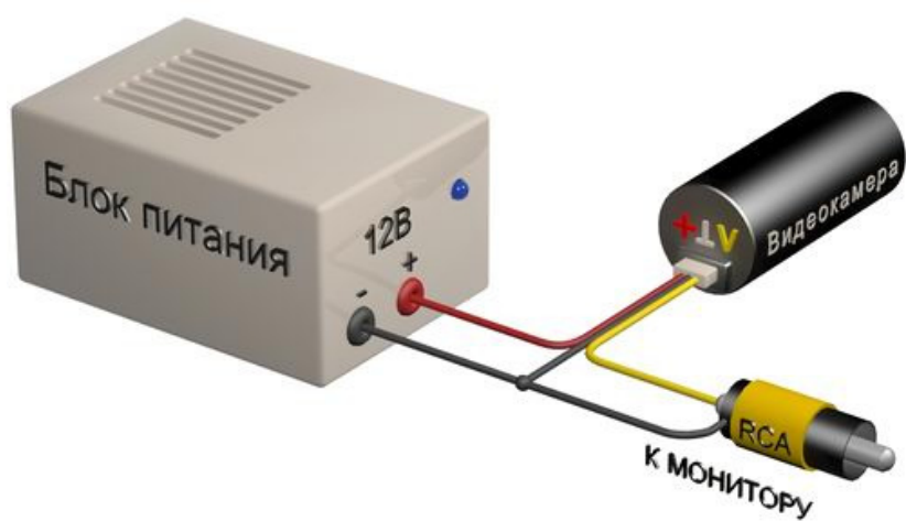
Схема подключения видеокамеры VB21CSHRX-W36