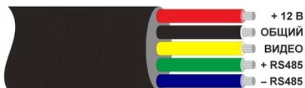
Схема подключения видеокамеры VB21S-P37P